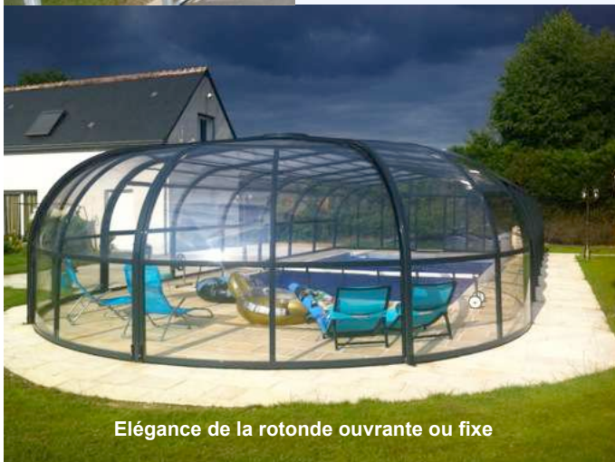
Elégance de la rotonde ouvrante ou fixe

Trappes relevables en 2 parties Permettant une parfaite aération en conservant la sécurité